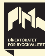
Frå gammal logo til ny

DiBK jobbar med kunnskap, byggjereglar og prosessar under, over og mellom aktørane på feltet. Logosymbolet symboliserer at Direktoratet for byggkvalitet er ein dynamisk organisasjon, samstundes som vi er ein styresmakt som viser retning.